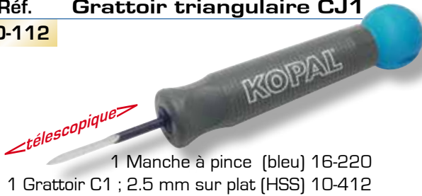
Réf. Grattoir triangulaire CJ1 10-112