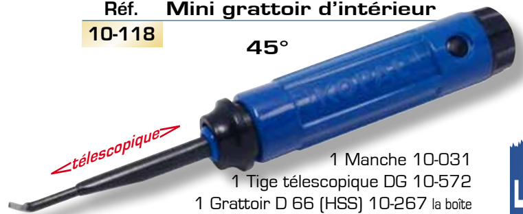
Réf. Mini grattoir d'intérieur 10-118