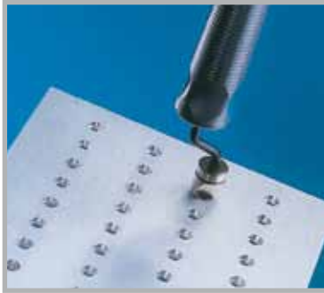
chanfreinage de trous Ø 0,4 à Ø 16 mm