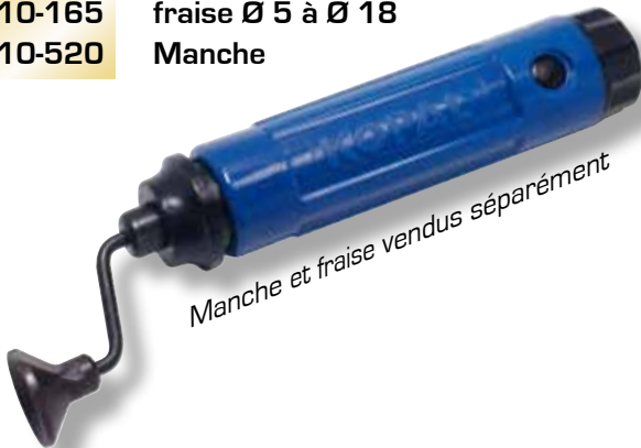
Manche et fraise vendus séparément