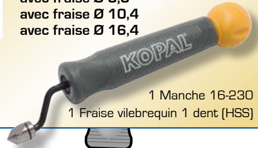
1 Manche 16-230 1 Fraise vilebrequin 1 dent (HSS)