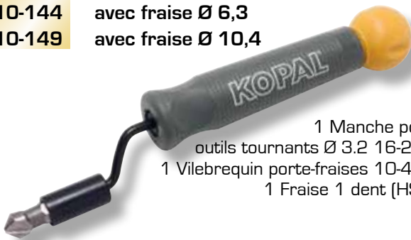
1 Manche pour outils tournants Ø 3.2 16-230 1 Vilebrequin porte-fraises 10-422 1 Fraise 1 dent (HSS)