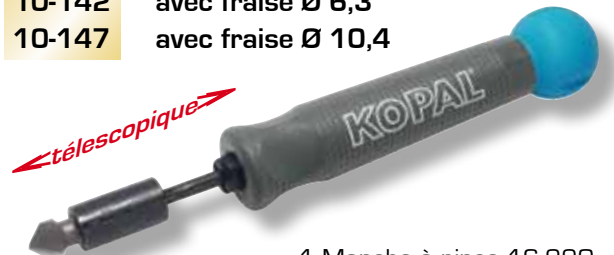
1 Manche à pince 16-220 1 Tige télescopique porte-fraises (1/4") 10-421 1 Fraise 1 dent (HSS)